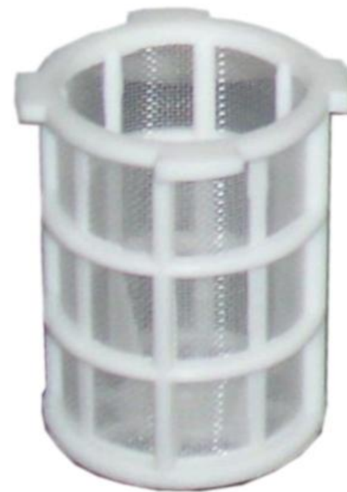
Siebkörbchen Ø 60 mm / H 100 mm MW 0,3, 0,5, 0,8, 1,2 mm