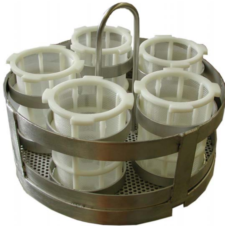
Adapter für Siebkörbchen für CADICA F3/235