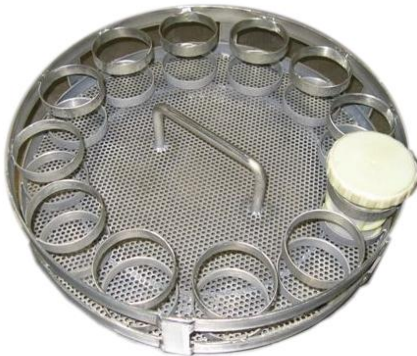
Adapter für Siebkörbchen für CADICA F1