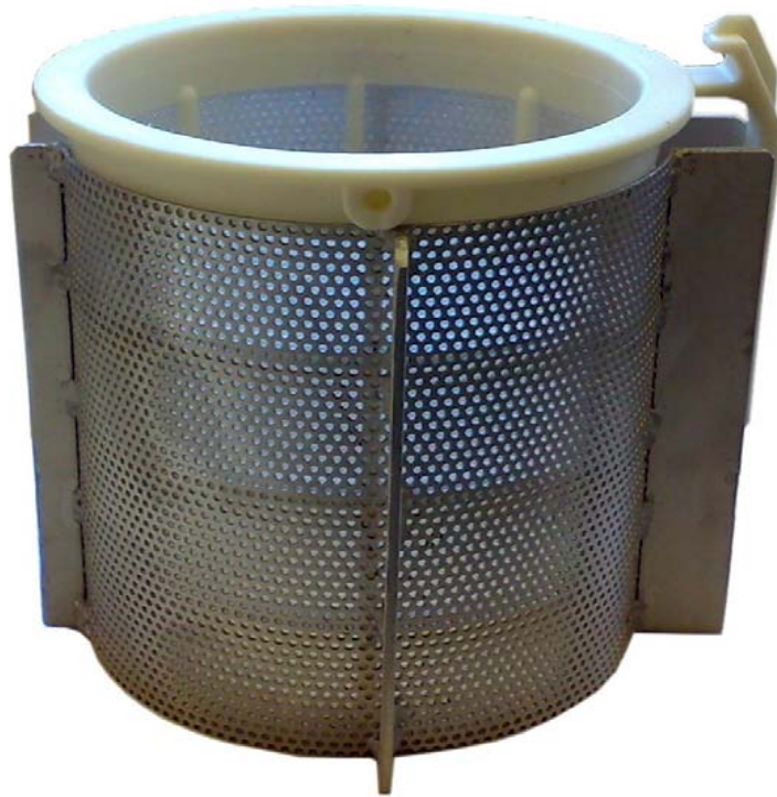
Adapter für Siebkörbe für CADICA F3