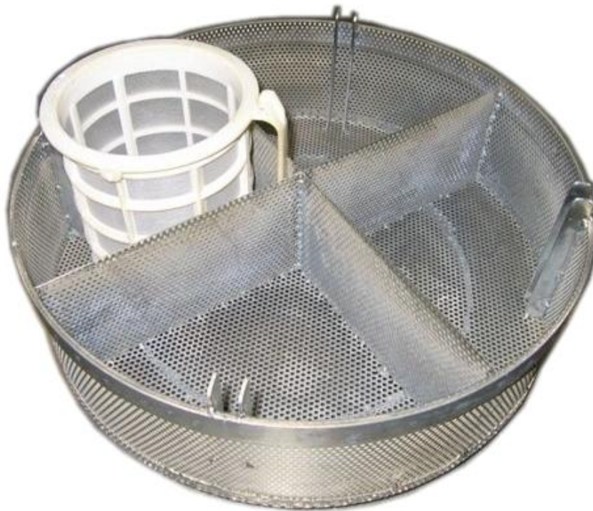
Adapter für Siebkörbe für CADICA F1