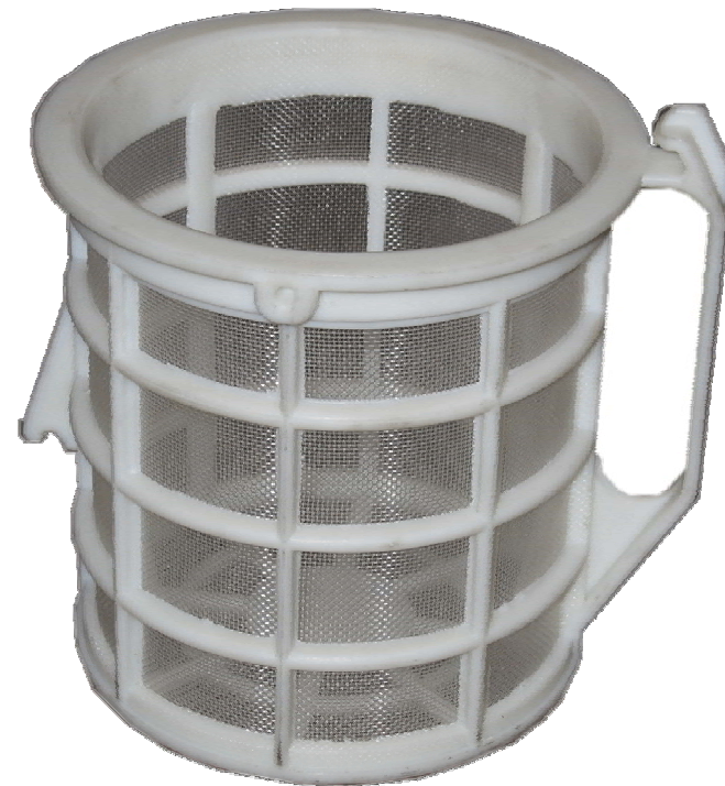
Siebkorb Ø 140 mm / H 160 mm MW 0,3, 0,5, 0,8, 1,2 mm